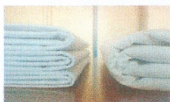
Vgl. mit klassischer Unterlage (3:1)

Wir können Ihnen nach Bedarf Unterlagen nach Ihren Wünschen herstellen: z. B. ausgerüstet mit bioActive, Aloe-Vera, Silberfäden. Auch mit Ihrem Logo!